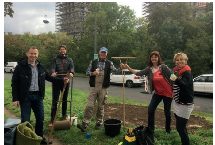
Pflanzaktion im Oktober am Juri-Gagarin-Ring

Ein großer Dank gilt auch allen Aktiven der Fördervereine, der Ortsvereine und des Stadtju-